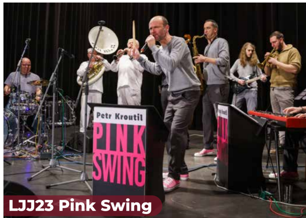
LJJ23 Pink Swing