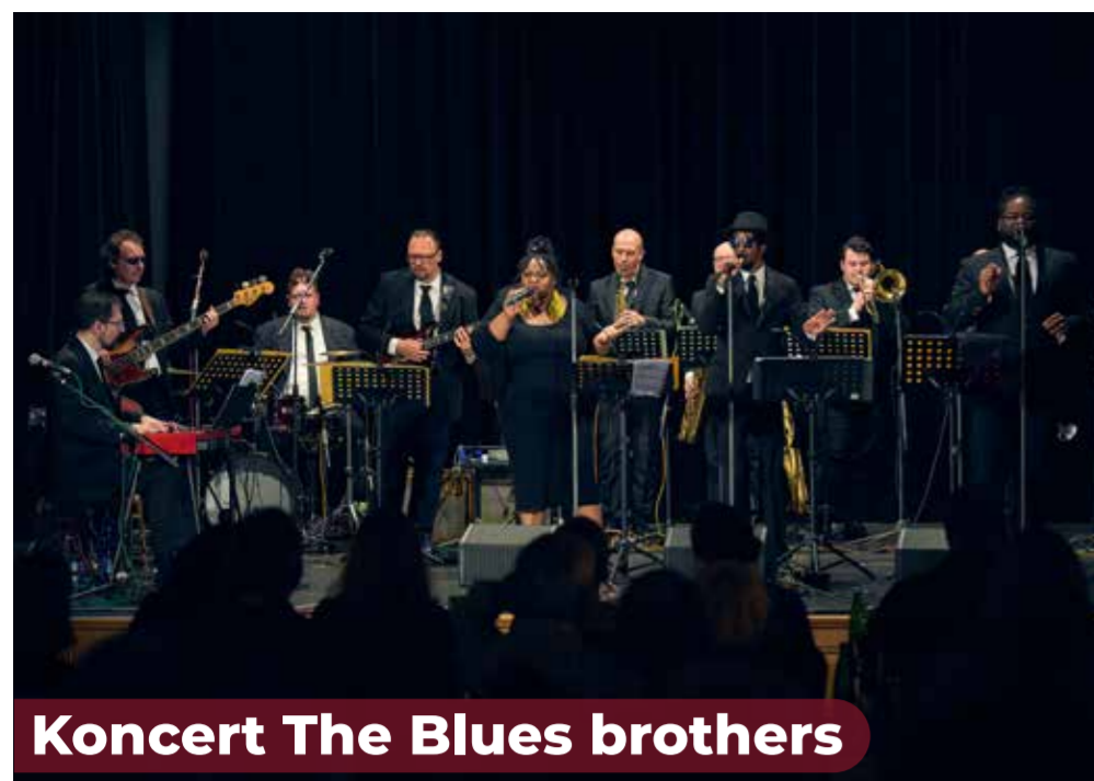
Koncert The Blues brothers