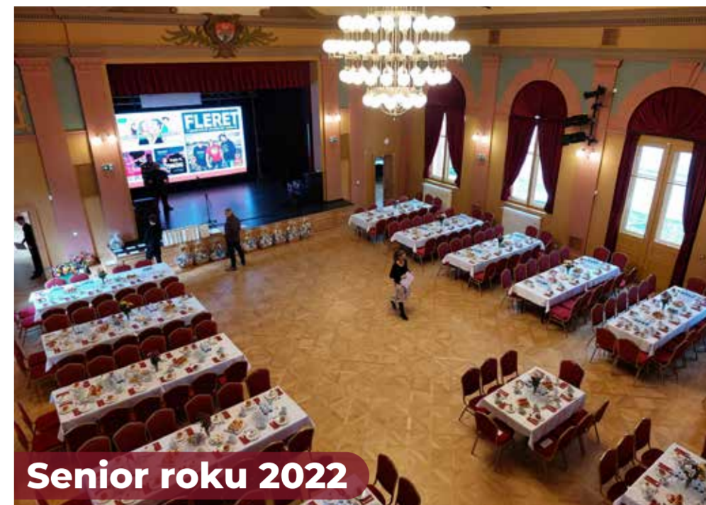
Senior roku 2022