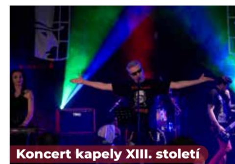
Koncert kapely XIII. století