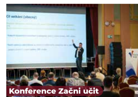
Konference Začni učit