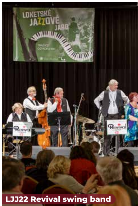
LJJ22 Revival swing band