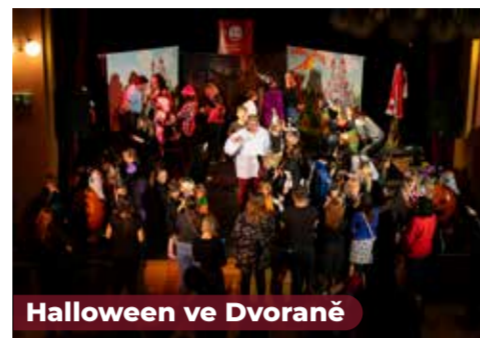
Halloween ve Dvoraně