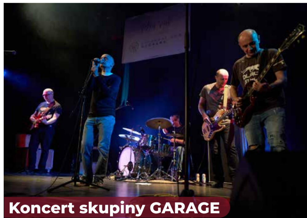
Koncert skupiny GARAGE