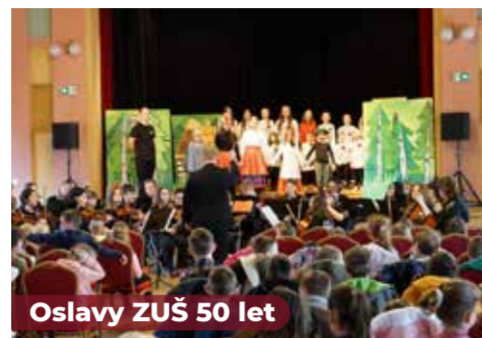
Oslavy ZUŠ 50 let