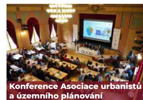
Konference Asociace urbanistů a územního plánování