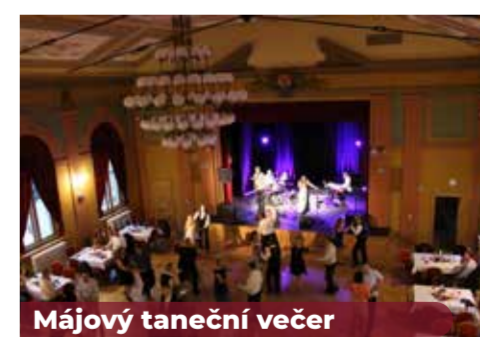
Májový taneční večer