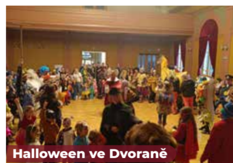
Halloween ve Dvoraně