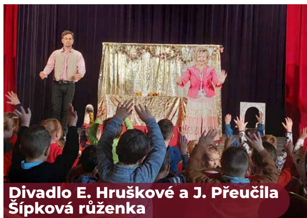
Divadlo E. Hruškové a J. Přeučila Šípková růženka