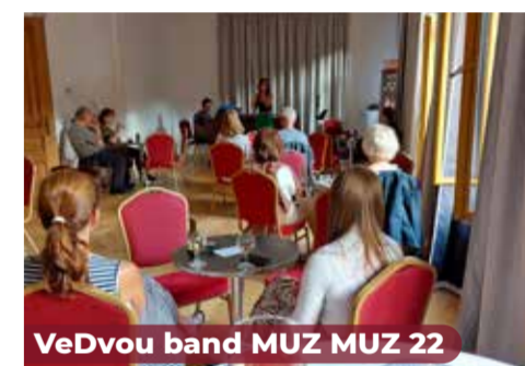
VeDvou band MUZ MUZ 22