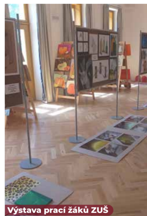
Výstava prací žáků ZUŠ