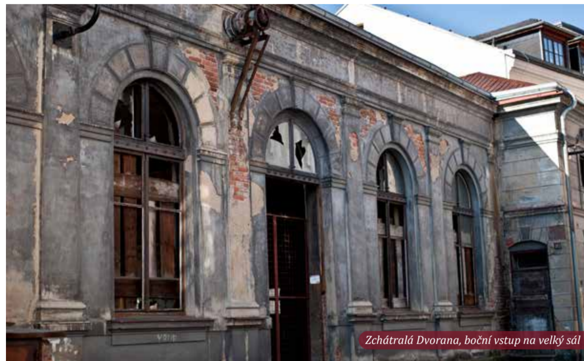
Zchátralá Dvorana, boční vstup na velký sál