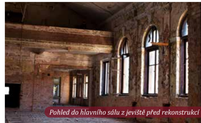
Pohled do hlavního sálu z jeviště před rekonstrukcí