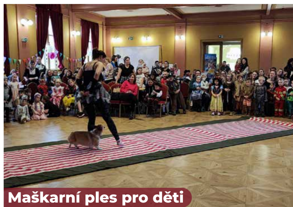
Maškarní ples pro děti