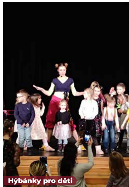
Hýbáňky pro děti