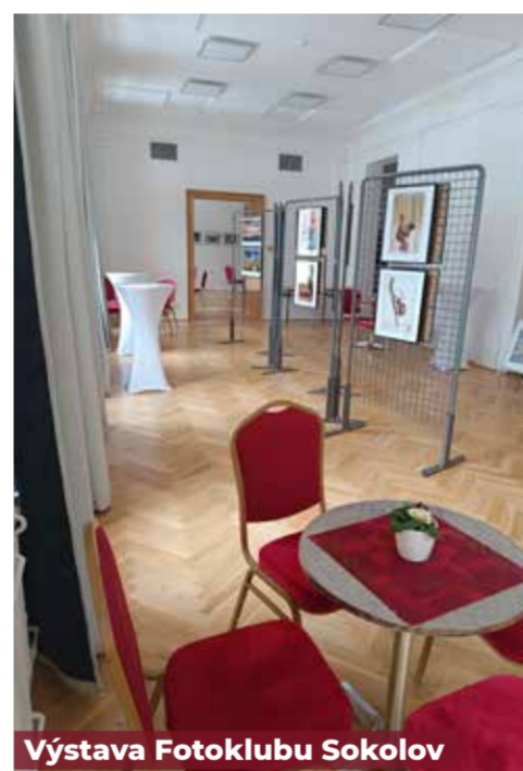
Výstava Fotoklubu Sokolov