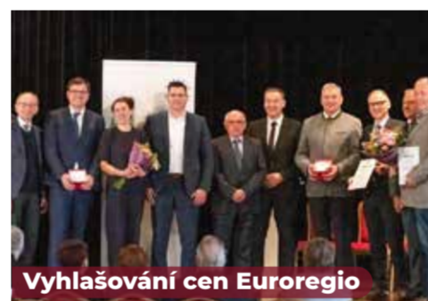
Vyhlašování cen Euroregio