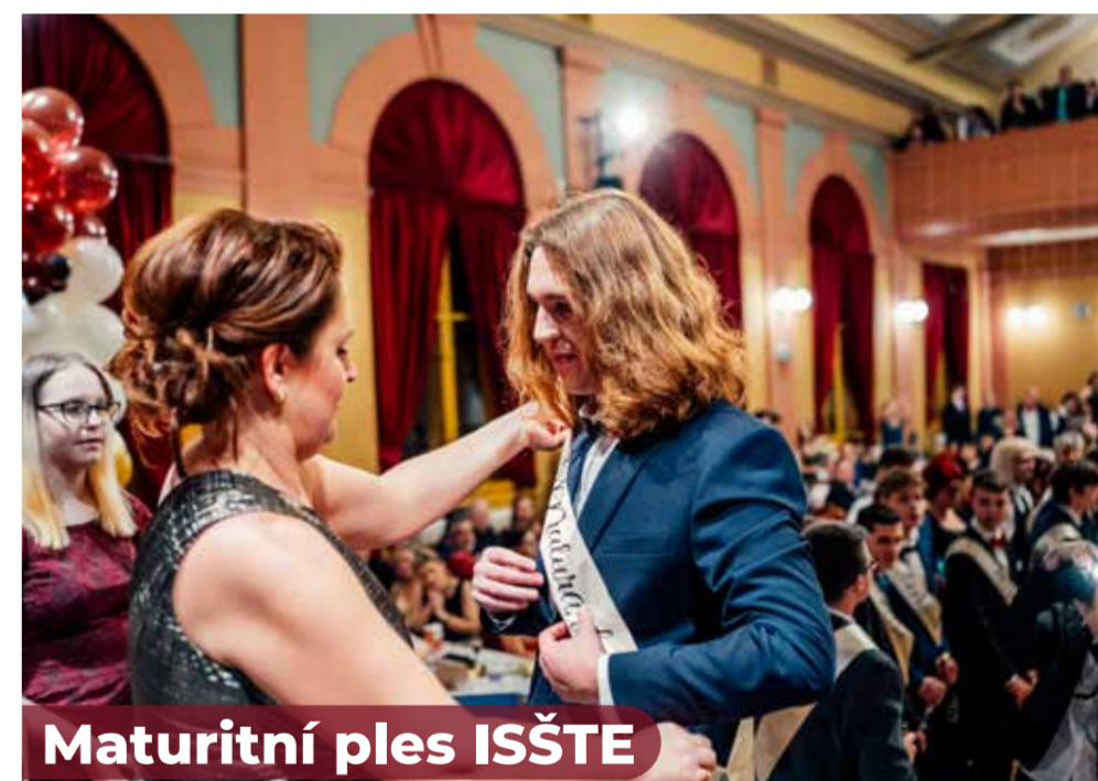
Maturitní ples ISŠTE