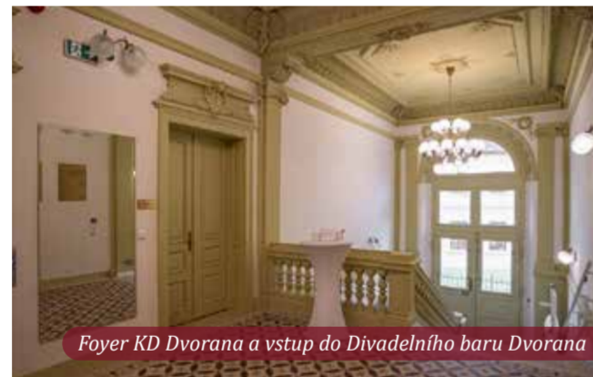
Foyer KD Dvorana a vstup do Divadelního baru Dvorana