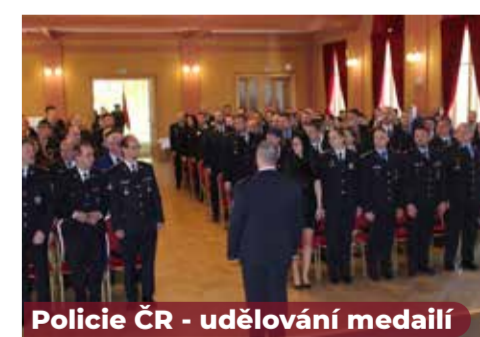
Policie ČR - udělování medailí