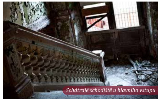
Šchátralé schodiště u hlavního vstupu