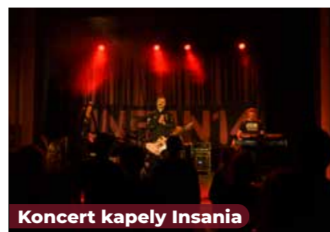
Koncert kapely Insania