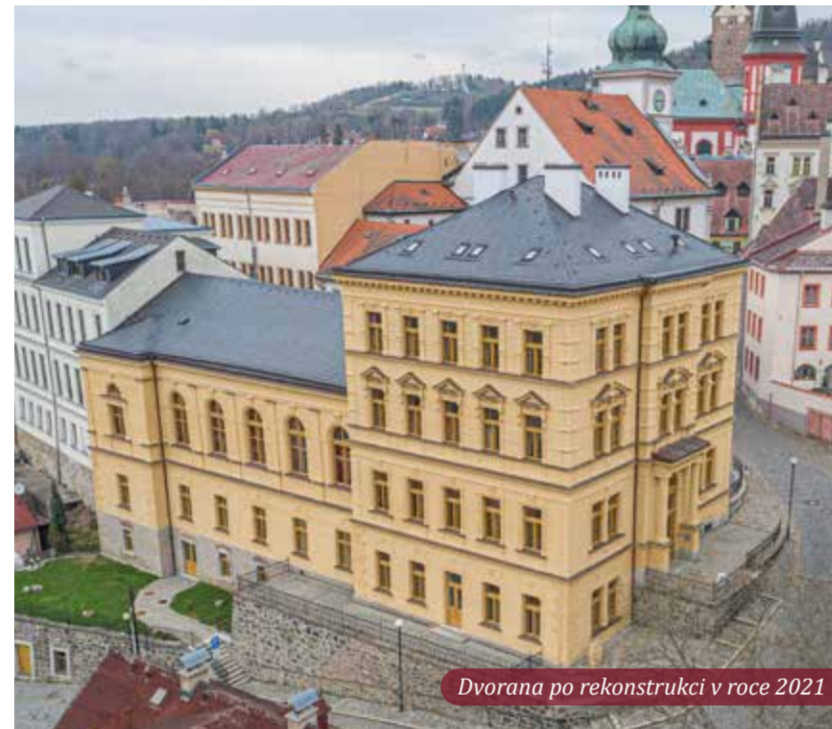
Dvorana po rekonstrukci v roce 2021