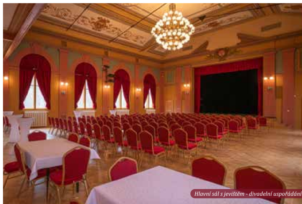
Hlavní sál s jevištěm - divadelní uspořádání