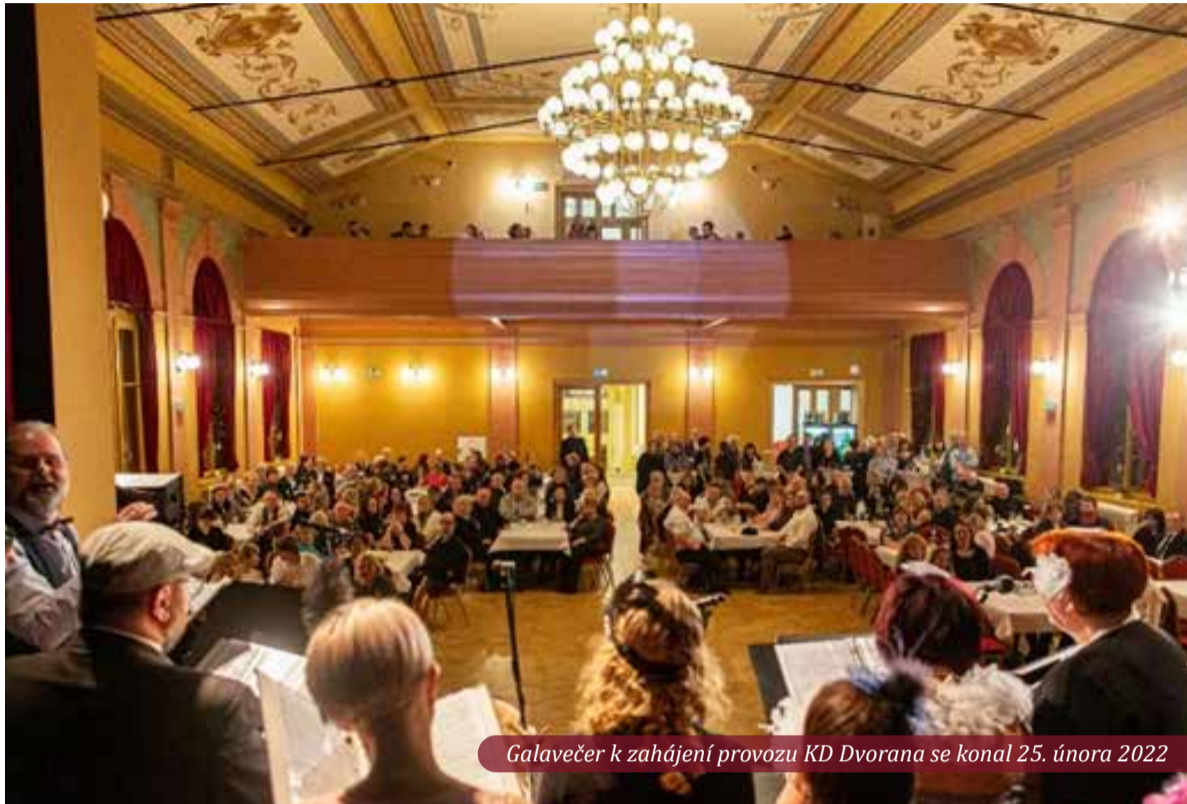
Galavečer k zahájení provozu KD Dvorana se konal 25. února 2022