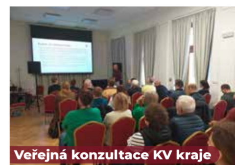
Veřejná konzultace KV kraje