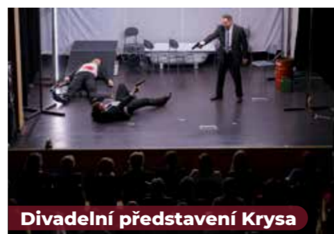
Divadelní představení Krysa