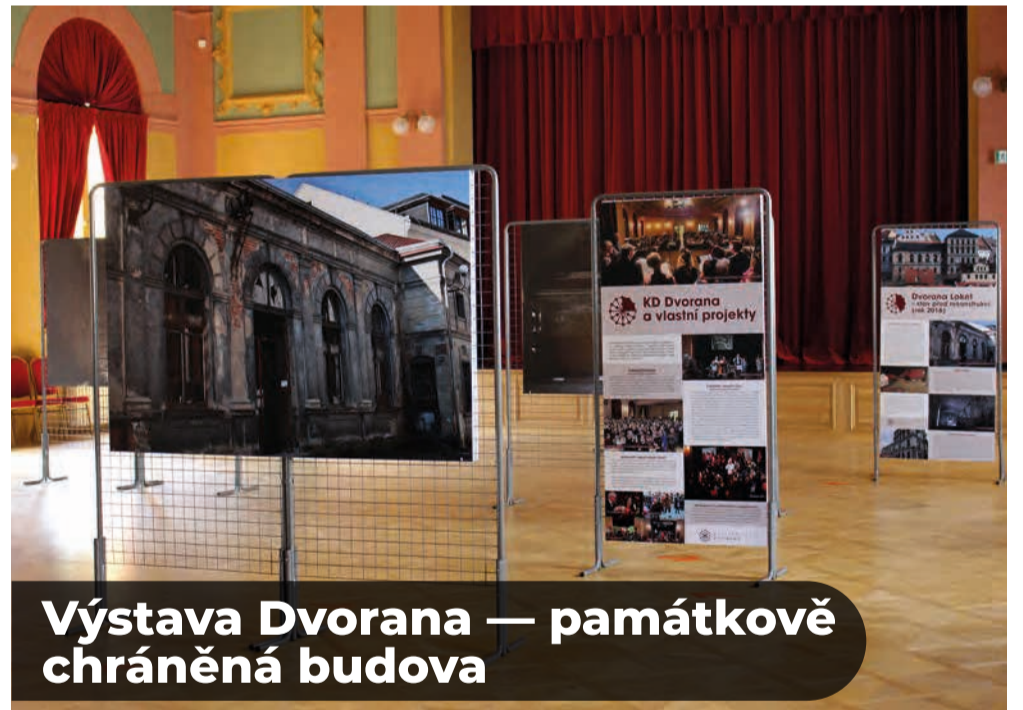
Výstava Dvorana — památkově chráněná budova