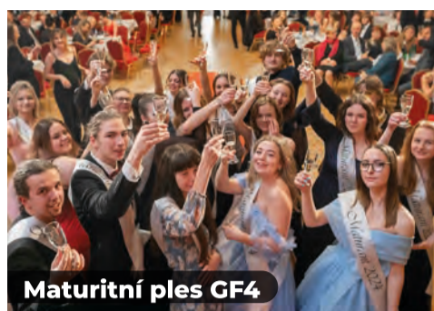
Maturitní ples GF4