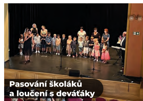
Pasování školáků a loučení s deváťáky