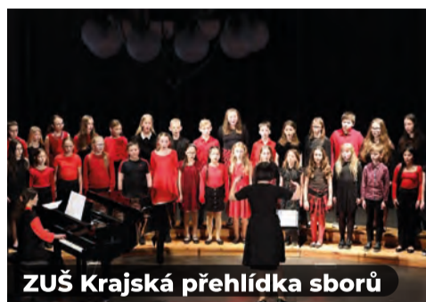
ZUŠ Krajská přehlídka sborů