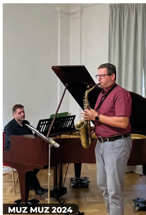
MUZ MUZ 2024