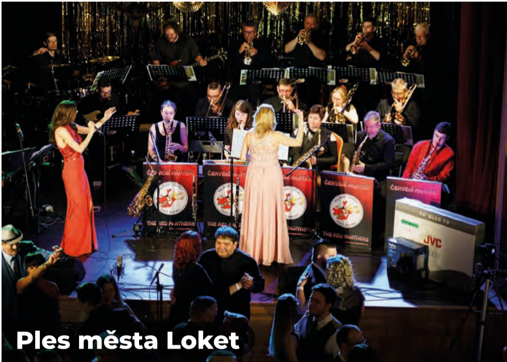
Ples města Loket