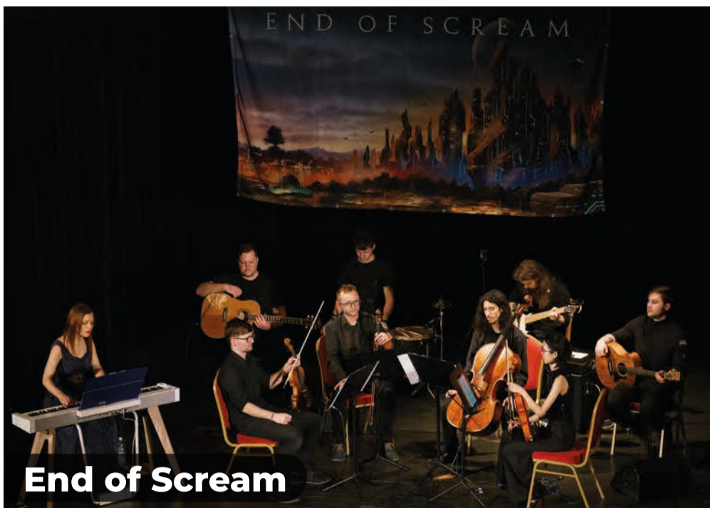
End of Scream