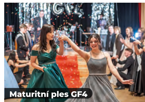
Maturitní ples GF4