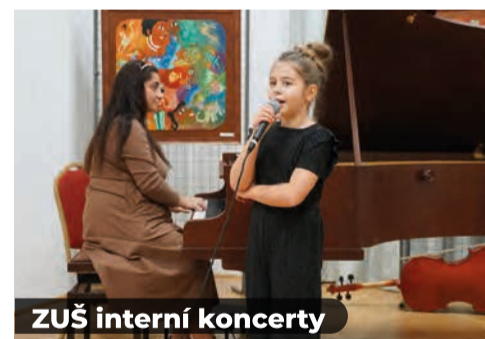
ZUŠ interní koncerty