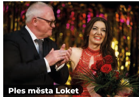
Ples města Loket