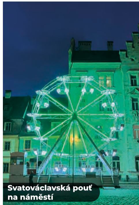
Svatováclavská pouť na náměstí