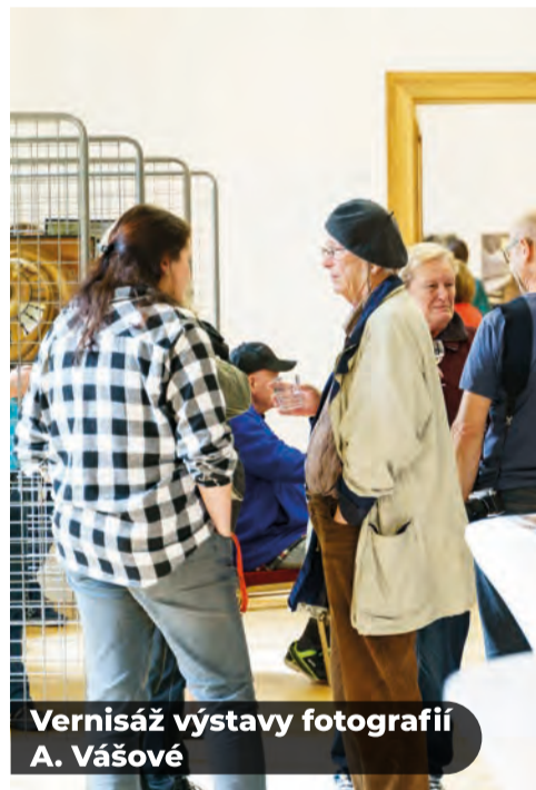
Vernisáž výstavy fotografií A. Vášové