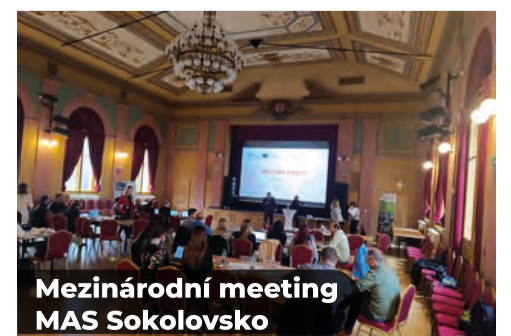
Mezinárodní meeting MAS Sokolovsko