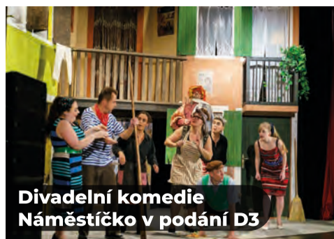
Divadelní komedie Náměstíčko v podání D3