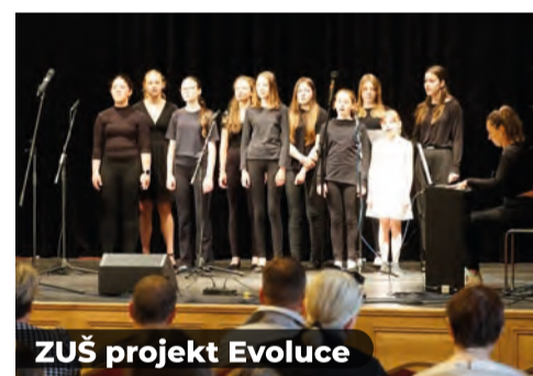
ZUŠ projekt Evoluce