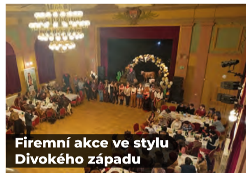
Firemní akce ve stylu Divokého západu